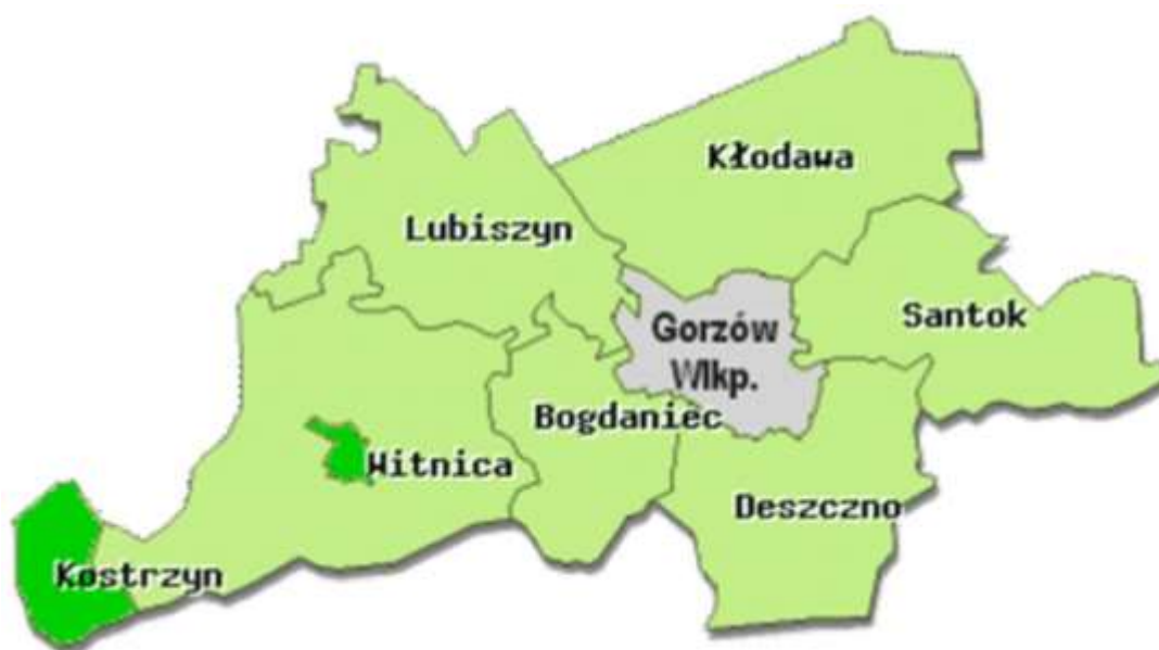
Rys. nr 3 Mapa terytorialna Powiatu Gorzowskiego